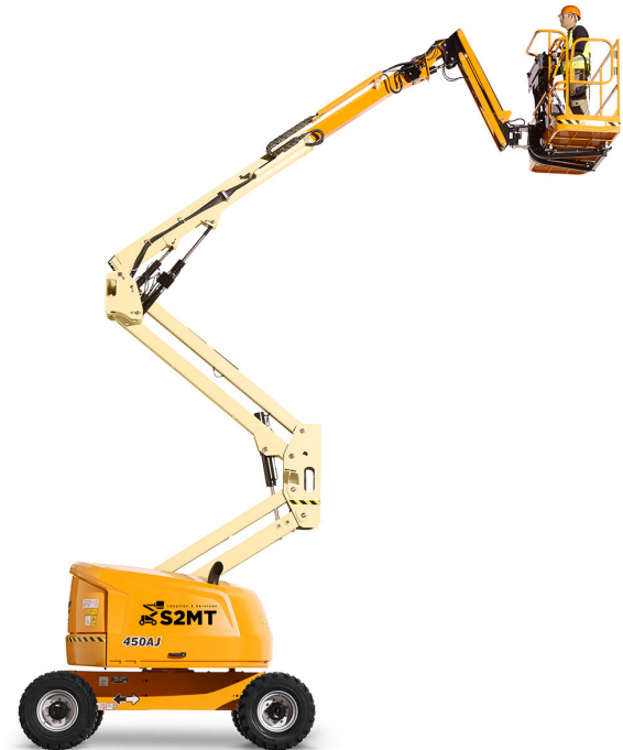
Schéma de la portée